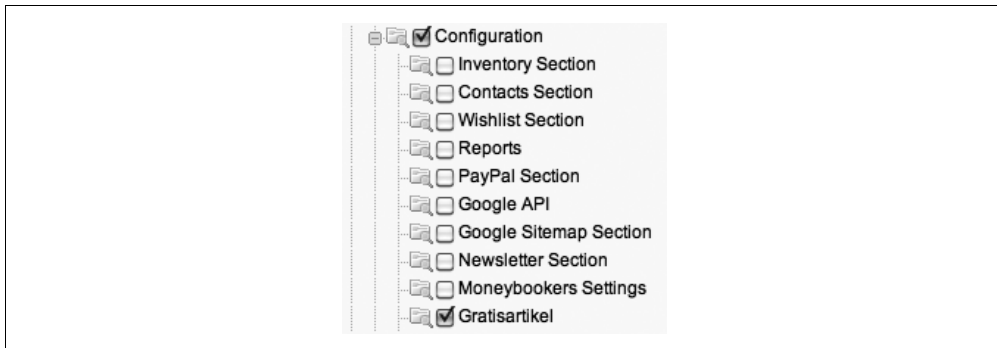
Abbildung 6-4: Im Admin-Panel kann nach Anpassung der ACL der Zugriff gesteuert werden.

Lassen Sie sich von dieser komplexeren Verschachtelung nicht aus der Ruhe bringen; diese resultiert letztlich aus der Magento-eigenen Konvention und muss mit übernommen werden. Sie sorgt dafür, dass bei der Einstellung der Admin-Gruppen im Admin-Panel ein neuer Eintrag erstellt wird, wie Sie in Abbildung 6-4 sehen können.