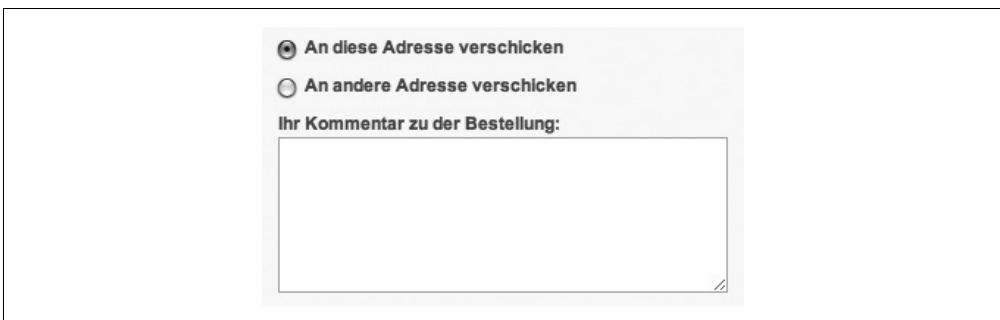
Abbildung 6-5: Ab sofort können Kunden ihrer Bestellung einen Kommentar hinzufügen

Voilà! Wenn Sie diese Schritte nachvollzogen haben, anschließend ein Produkt in den Warenkorb legen und den Bestellprozess beginnen, wird ein neues Eingabefeld wie in Abbildung 6-5 angezeigt.